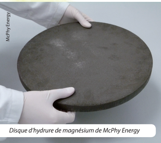
Disque d'hydrure de magnésium de McPhy Energy

L'hydrogène produit par cette centrale sera stocké à l'état solide dans six containers utilisant la technologie de McPhy. La quantité d'énergie stockée sous forme d'hydrogène dans chaque container représente plus de 2 mégawattheures, cette capacité pouvant être augmentée. Le stockage de l'hydrogène s'effectuant à basse pression, il peut être transporté facilement dans le pays.